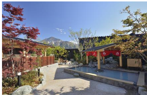
西武秩父駅前温泉 祭の湯 露天風呂(女湯)