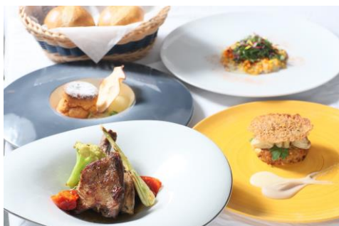
ランチコースメニュー(2020年10月~12月)