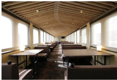
車両内観(4号車)イメージ