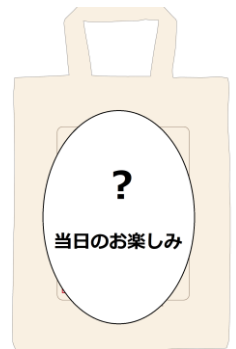
トートバッグ(イメージ)

乗車チケット(西武線1日フリーきっぷ)、お食事代、記念品代、諸税 JTB時刻表編集長トークショー代