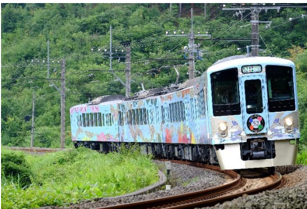
西武 旅するレストラン「52席の至福」

※新型コロナウイルス感染症の感染拡大の状況、当日の列車の運行状況等によっては、企画のすべてまたは一部 の中止・変更が生じる可能性があります。