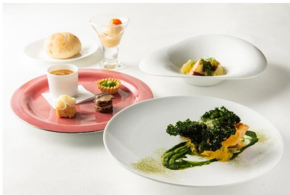
ブランチコースメニュー

※新型コロナウイルス感染症の感染拡大の状況、当日の列車の運行状況等によっては、企画のすべてまたは一部 の中止・変更が生じる可能性がございます。