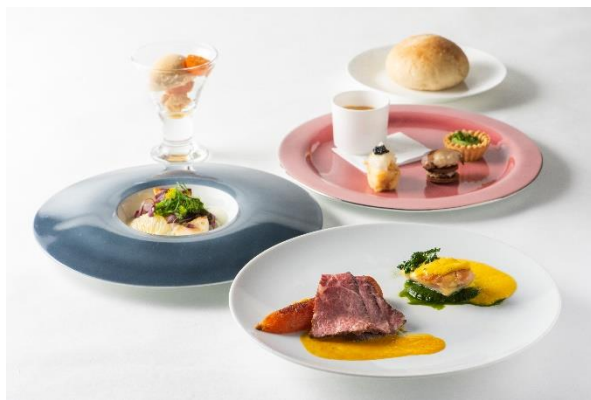
ディナーコースメニュー